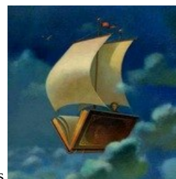
adaptação para e-book: Marcelo Moraes

tradução: Débora Chaves preparo de originais: Raquel Zampil revisão: Hermínia Totti Jardim e Rebeca Bolite diagramação: Valéria Teixeira capa: Natali Nabehura